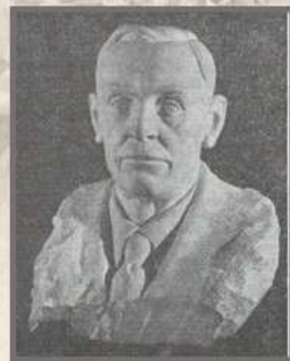
В.Ф. Макуха, бюст Я. Купалы, 1958г., мрамор