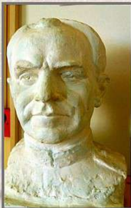
В.Ф. Макуха, скульптурный портрет Василия Захаровича Коржа (гипс, скульптурная лепка, без датировки, военно- исторический музей им. Д.К. Удовикова, г. Дрогоичин)