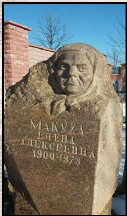
ПАМЯТНИК МАТЕРИ СКУЛЬПТУРНЫЙ ПОРТРЕТ Е.А. МАКУХИ, ВЫСЕЧЕННЫЙ НА ГРАНИТНОМ ВАЛУНЕ, НАХОДЯЩИЙСЯ НА СТАРОМ ГОРОДСКОМ КЛАДБИЩЕ Г. ДРОГИЧИН.