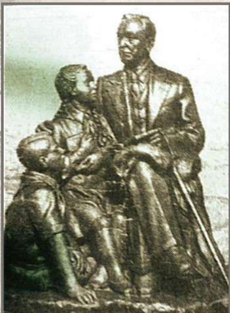
В. Макуха, «Янка Купала с пионерами» (1959 г., гипс)