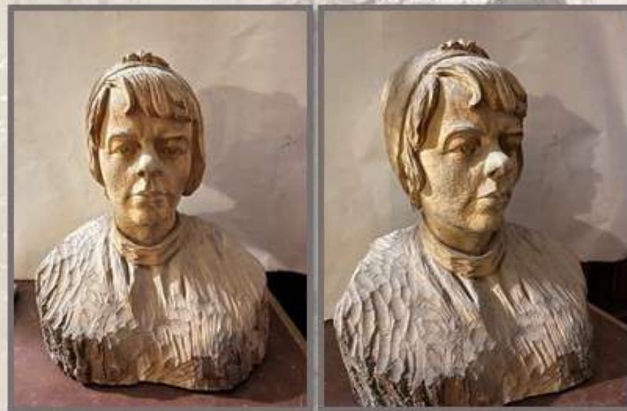
В.Ф. Макуха, «Доярка», техника резьбы по дереву, 1967 г.

В столичном Национальном Историческом музее хранятся ещё 5 деревянных скульптур: «Гая», «М. Горький», «Вера Хоружая», «Янка Купала» и «Золотая рыбка».