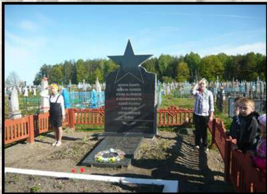
БРАТСКАЯ МОГИЛА, 2022 Г.