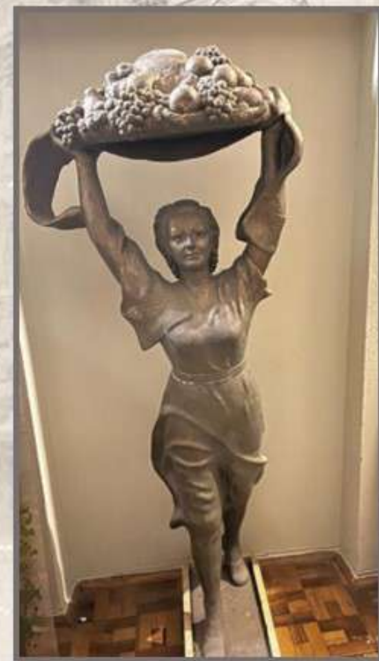
В.Ф. Макуха Скульптура «Изобилие» («Богатство»), гипс Музей Белорусского Полесья, г. Пинск

В 1953 году работы мастера участвуют в Республиканской выставке, посвященной декаде белорусского искусства в Москве. Скульптура «Богатство» («Изобилие») – другой вариант названия), отобразившая колхозную деревню, успехи, достигнутые в сельском хозяйстве за годы Советской власти, отмечена Благодарностью Республиканского Дома Народного Творчества и приобретена Пинским краеведческим музеем.