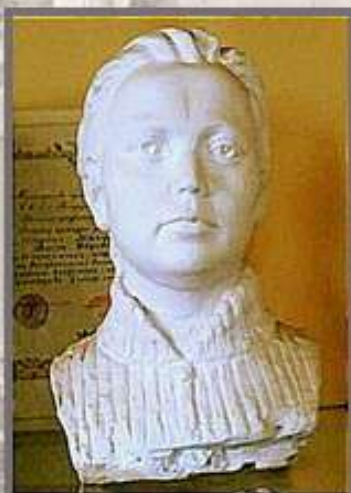
В.Ф. Макуха, скульптурный портрет Зои Космодемьянской (гипс, скульптурная лепка, без датировки, военно- исторический музей им. Д.К. Удовикова, г. Дрогоичин)