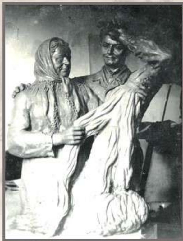
В.Ф. Макуха, скульптурная композиция «Льноводы» («Лён»)