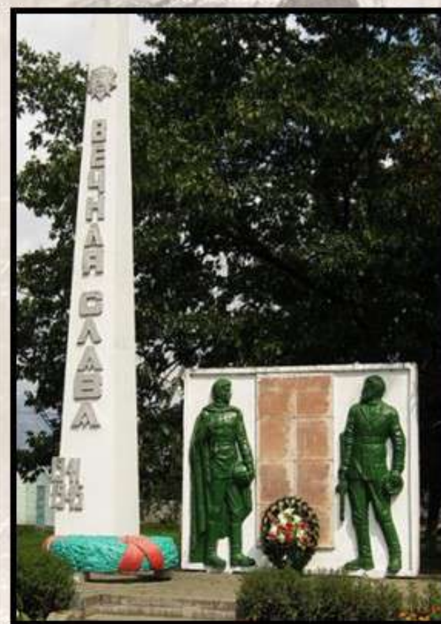
ПАМЯТНИК ЗЕМЛЯКАМ ОКОЛО ЗДАНИЯ СЕЛЬСОВЕТА Д. БРАШЕВИЧИ. НАСЫПАН В 1975 Г. ДЛЯ УВЕКОВЕЧЕНИЯ ПАМЯТИ 144 ЗЕМЛЯКОВ, ПОГИБШИХ В ГОДЫ ВЕЛИКОЙ ОТЕЧЕСТВЕННОЙ ВОЙНЫ. НА ВЕРШИНЕ КУРГАНА УСТАНОВЛЕН ОБЕЛИСК, РЯДОМ С НИМ – СТЕНА, НА КОТОРОЙ РАСПОЛОЖЕНЫ ПЛИТЫ С ИМЕНАМИ ПОГИБШИХ [1, 8].