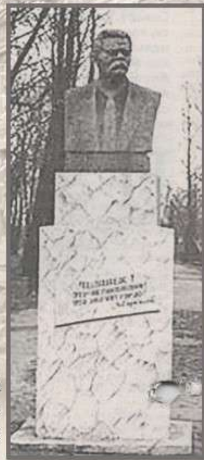
Гранитный Бюст М. Горького

Настоящим шедевром мастера был гранитный бюст писателя Максима Горького, стоявший десятилетиями на входе в городской парк. Авторство работы, по мнению жителей г. Дрогичина, принадлежит именно В.Ф. Макухе. Но эта информация документами не подтверждена [4].