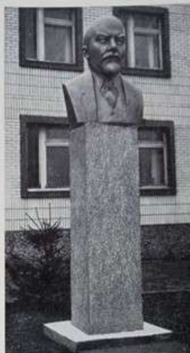
477. Помнік У. І. Ленину.

480. ПМНІК ЧКАЛАВУ Валерыю Іаўлавічу (гіст.). Пасуіраць будынка праўлення колгаса імя В. П. Чкалава.