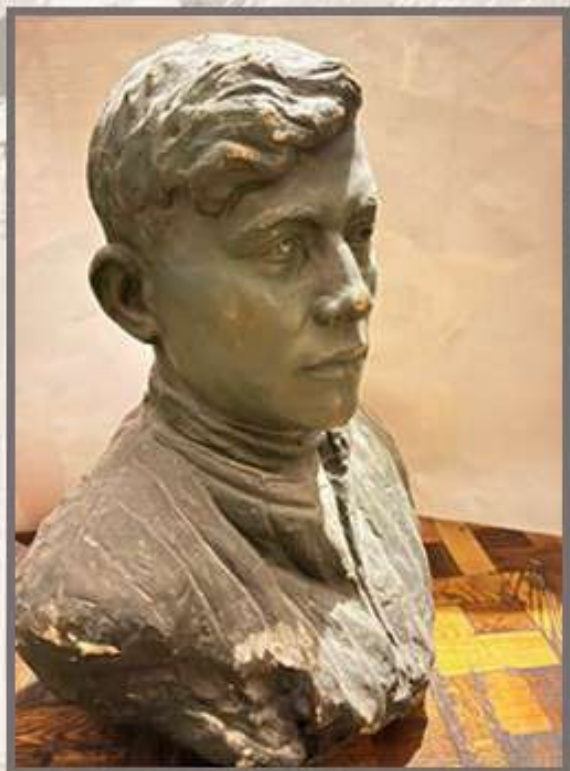
В.Ф. Макуха, «Тракторист» (1957 г., гипс, лепка) Музей Белорусского Полесья, г. Пинск

«Тракторист» — скульптура в образе которого автор сумел воплотить народную мудрость и жизнеутверждающую силу. Скульптурный портрет демонстрировался на Всесоюзной выставке достижений народного хозяйства в Москве и автор за эту работу был награждён бронзовой медалью ВДНХ СССР.